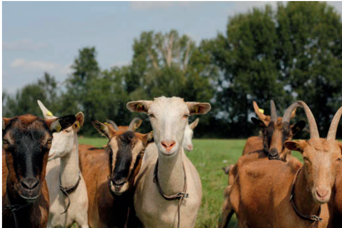
40 Ziegen ziehen auf das Klostergut