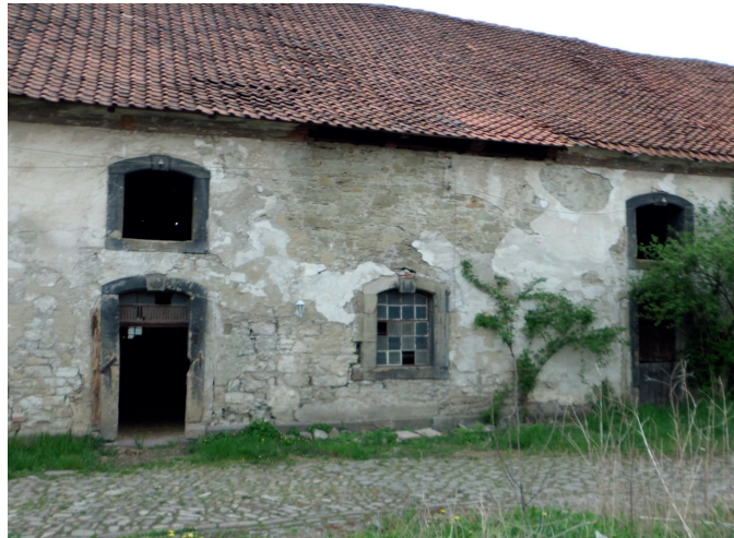
Stallgebäude von außen

Die Arbeit mit den Ziegen werden wir so gestalten, dass auch Menschen mit Hilfebedarf in unserer Landwirtschaft eine Beschäftigung finden werden.