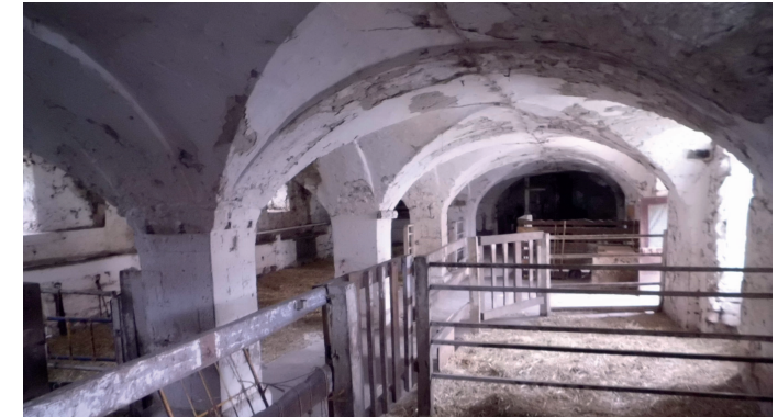
Alter Pferdestall - Neuer Ziegenstall

Email: klostergut-heiningen@gmx.de www.klostergut-heiningen.info