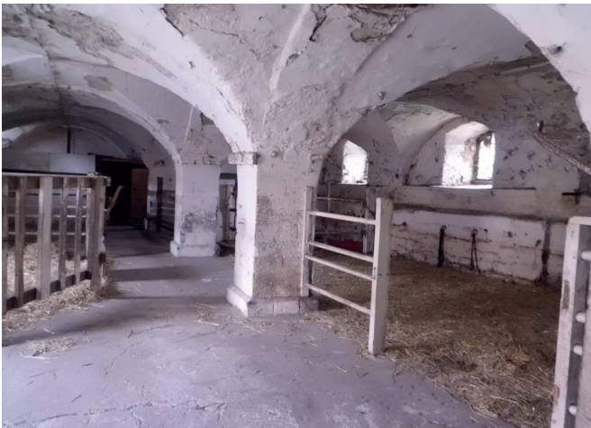
Der Arbeitsplatz im Stall

Die Tiere brauchen Futtertröge und Raufen, eine Wasserversorgung, Melkplatz und Milchkammer sowie diverse Abtrennungen. Für den Auslauf sind dann sichere Zäune und Schutzeinrichtungen für die Bäume zu bauen.